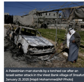
A Palestinian man stands by a torched car after an Israeli settler attack in the West Bank village of Jinsafut, January 21, 2025