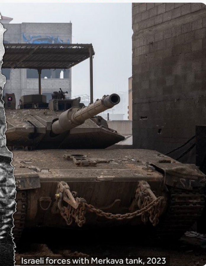
Israeli forces with Merkava tank, 2023