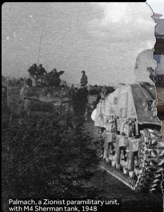
Palmach, a Zionist paramilitary unit, with M4 Sherman tank, 1948