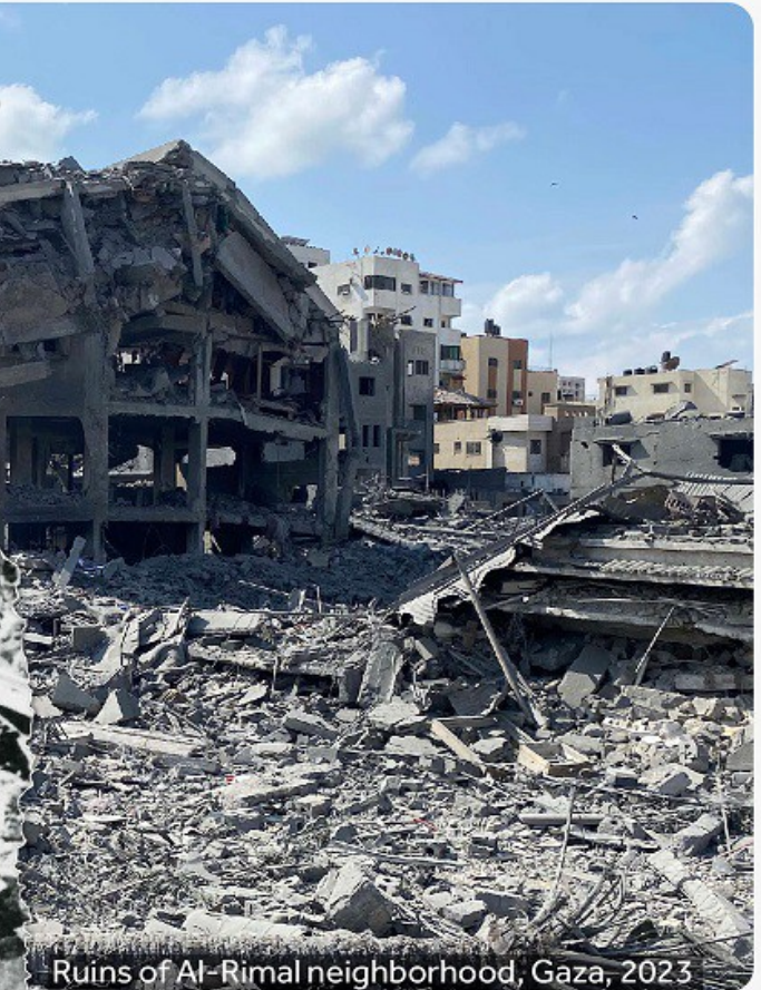
Ruins of Al-Rimal neighborhood, Gaza, 2023