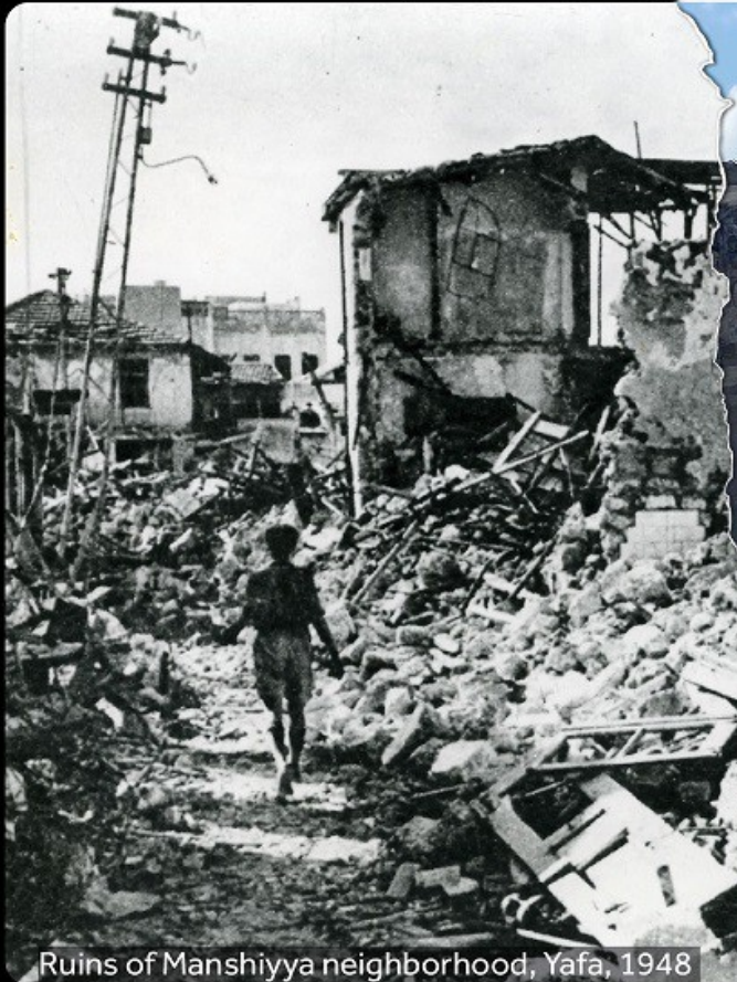
Ruins of Manshiyya neighborhood, Yafa, 1948